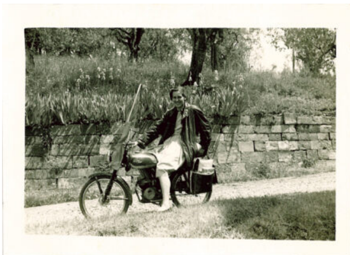
Margherita Hack nel 1954 a Firenze.

giugno e visite speciali alla Specola M. Hack, Stazione Osservativa di Basovizza, rientrano nella cornice del congresso scientifico Hack100 , organizzato questa settimana dall'Inaf a Trieste.