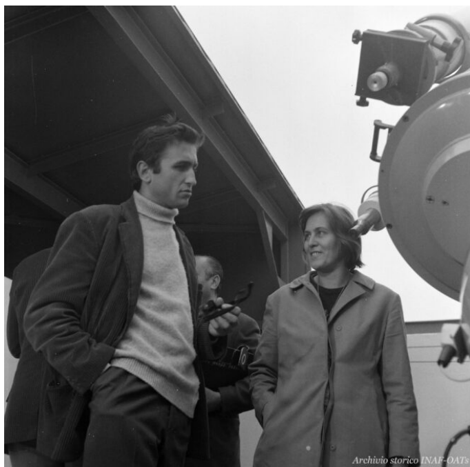
Margherita Hack presso l'Osservatorio astronomico di Trieste, oggi sede Inaf.

Cento anni fa, il 12 giugno 1922, nasceva a Firenze Margherita Hack . Nei decenni a venire, l'astrofisica toscana avrebbe dato un forte impulso alla ricerca e alla comunicazione pubblica della scienza in Italia, diventando la prima donna a dirigere un osservatorio astronomico nel nostro paese, quello di Trieste, oggi sede Inaf. La sua figura, sia come astronoma che come divulgatrice, ha lasciato il segno nella società e nella comunità scientifica italiana. Questa settimana l'Inaf ne celebra l'eredità astronomica e culturale attraverso una serie di eventi, sia online che in presenza.